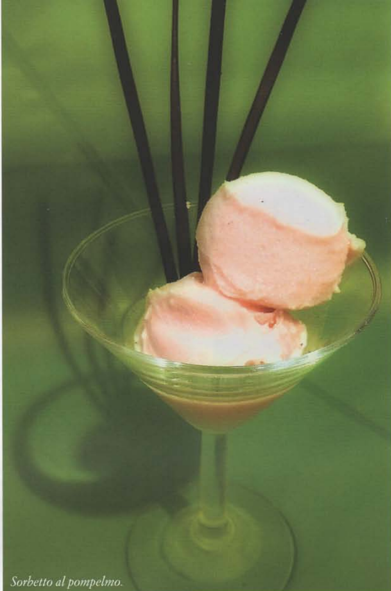
Sorbetto al pompelmo.