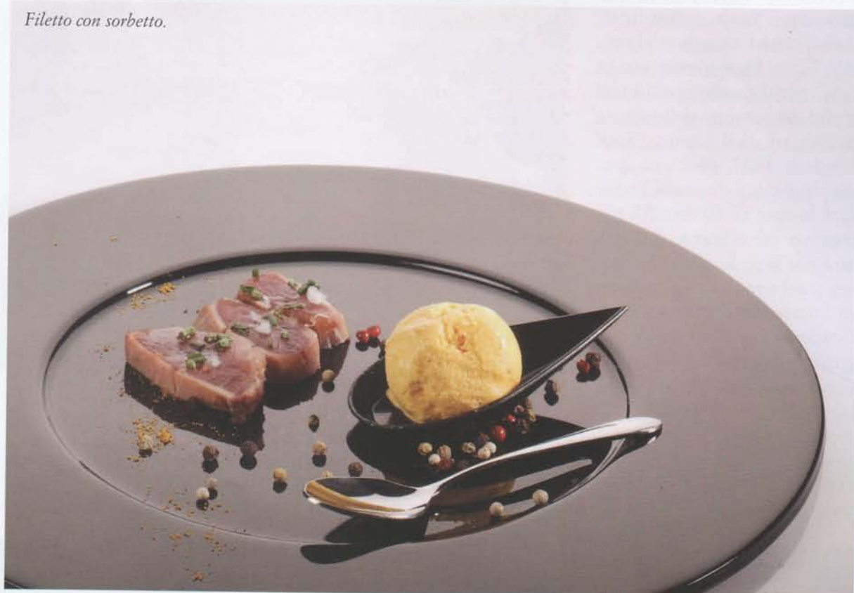
Filetto con sorbetto.

I suoi due maestri sono stati internet e i libri di Luca Caviezel,