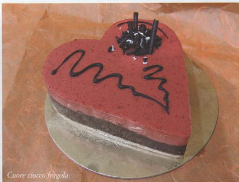
Cuore ciocco fragola.

ricerca di gusti nuovi da proporre ai suoi clienti e mentre l'estate scorre sta già elaborando il prossimo futuro, inserendo addirittura... le alghe, visto che lui è vegetariano!